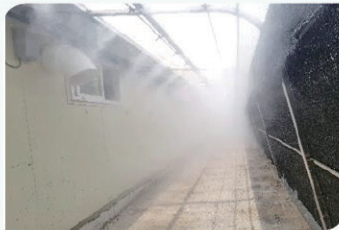
바이오커튼 내부 안개분무