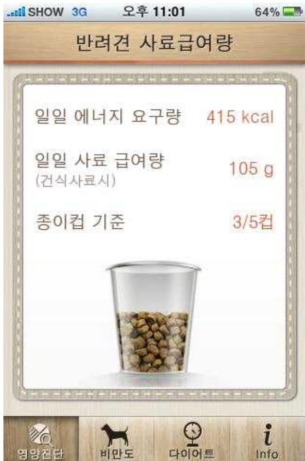
<그림> 애견사료 열량 계산기 애플리케이션 화면